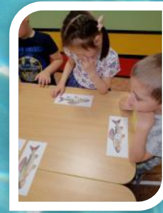
Согласованию числительных с существительными