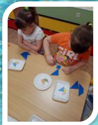
Игра «Танграм» Лодочка