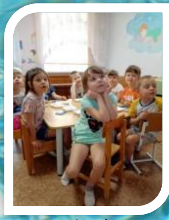
Образованию названий детенышей животных в единственном числе