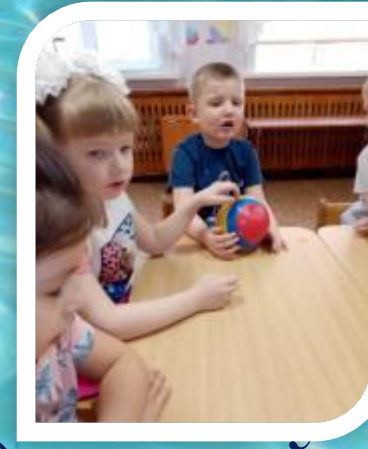
Составление предложений о Байкале, подбор антонимов