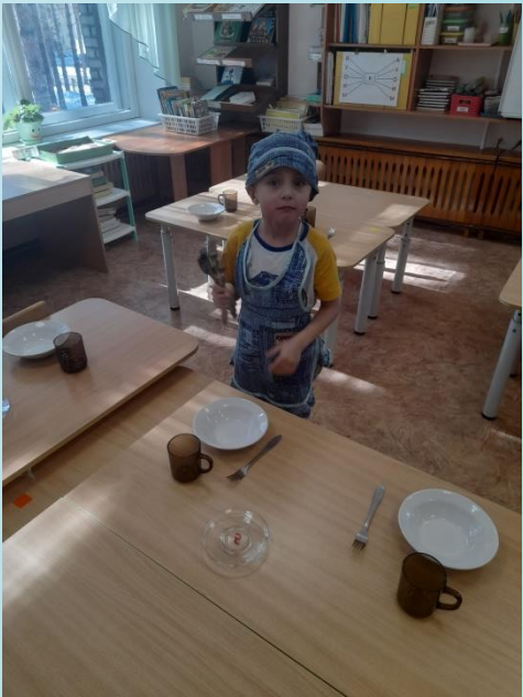
Дежурство по столовой