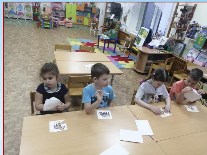
Разрезные картинки собирали