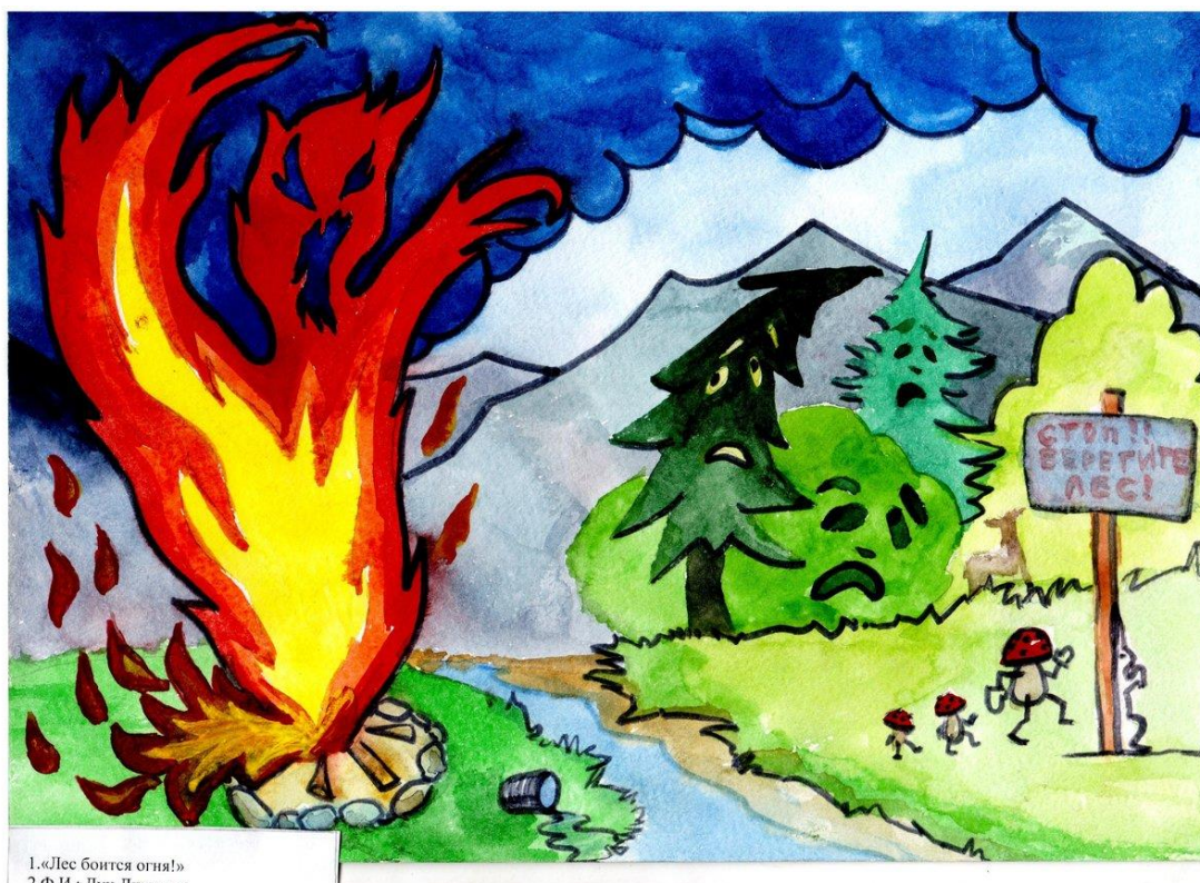
1. «Лес боится огня!» 2. Ф.И.: Дан Димчич