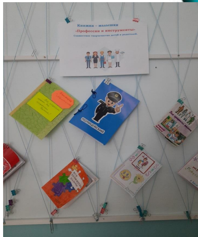
Совместная работа детей с родителями