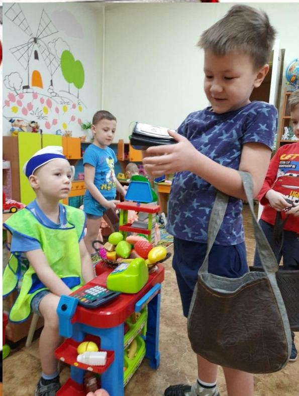
В магазине «Лакомка»